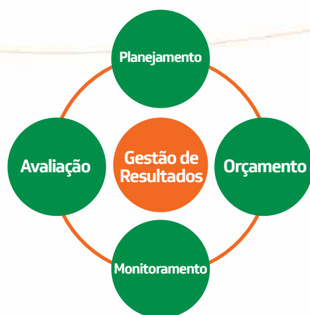
Figura 1 – Ciclo da Gestão Estratégica

Como parte do Ciclo da Gestão Estratégica, na ótica da Gestão para Resultados (figura 1), o monitoramento e a avaliação da execução das políticas propostas devem ocorrer continuamente e corrigir, sempre que necessário, os rumos daquilo que foi planejado.