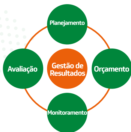
Figura 1 – Ciclo da Gestão Estratégica

O PPA, como mencionado anteriormente, adota a Participação Cidadã como uma premissa para orientação na escolha das políticas públicas do Estado. Assim sendo, o processo participativo está presente na elaboração do plano e deve permanecer durante todo o seu ciclo de gestão. Esse entendimento está alinhado ao conceito de governança pública, que tem por foco não só as entidades públicas isoladamente, mas a articulação e colaboração entre elas e delas com a sociedade civil, possibilitando à administração pública atender às demandas e desafios da sociedade considerando a complexidade dos problemas que se apresentam no mundo moderno.